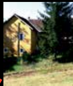
Casa Sciverna Media