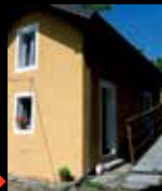
Casa del Custode