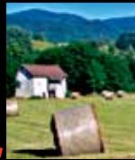
Casa dei Cinghiali